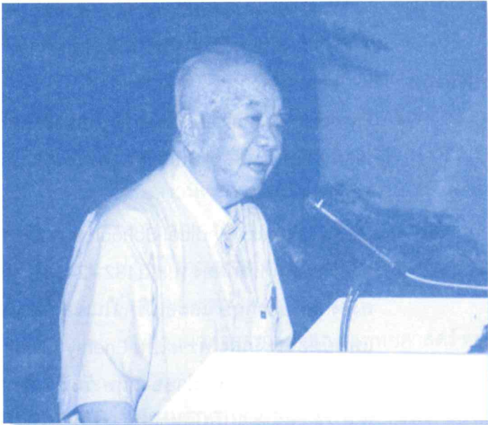
ศาสตราจารย์เกียรติคุณ เปรม บุรี