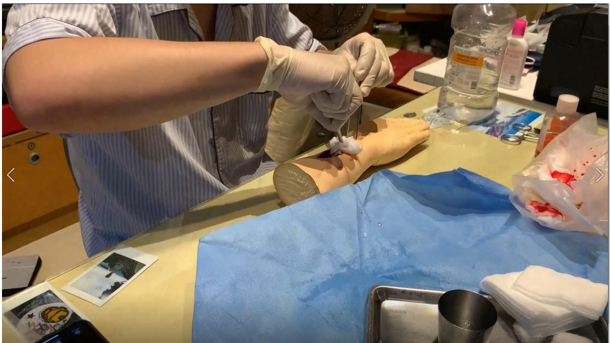
Set dressing ไม่อยู่ในเฟรม