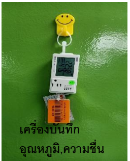
เครื่องบันทึกอุณหภูมิ, ความชื้น