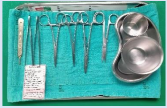
การจัดเตรียมแบบเดิม

1.2 ระบุวัตถุประสงค์ในการดำเนินการครั้งนี้ - เพื่อลดจำนวนการจัดเตรียมเครื่องมือและอุปกรณ์ผิดพลาด - เพื่อลดจำนวนการจัดวางเครื่องมือในชุดทำหัตถการผิดพลาด 1.3 ระบุตัวชี้วัด