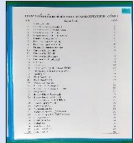
แฟ้มรูปภาพประกอบ