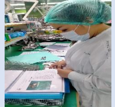
การจัดเตรียมเครื่องมือ