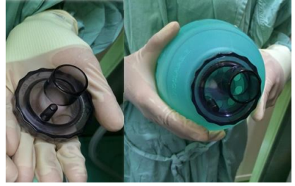
2.5 นำชิ้นส่วน Intake valve ที่เหลือมาต่อปิด