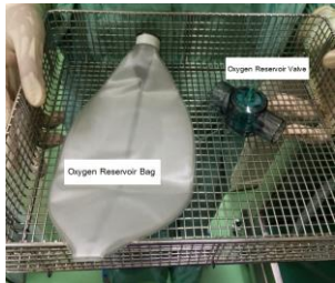
1.1 ส่วนที่ 1 แยกได้ทั้งหมด 2 ชิ้น ดังภาพ