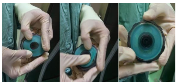
2.2 นำ Intake disc membrane ใส่เข้ากับ Intake valve ขึ้นมาให้ลงล็อก