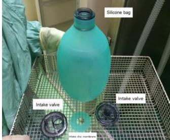
2.1 ส่วนที่ 2 แยกได้ทั้งหมด 4 ชิ้น