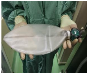
1.2 นำ Oxygen Reservoir Valve ต่อเข้ากับ Oxygen Reservoir Bag