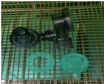
ส่วนที่ 3 แยกชิ้นส่วนได้ทั้งหมด 4 ชิ้น

3.1 นำแผ่นเขียวทั้ง 2 วงใส่คู่กับชิ้นส่วนพลาสติก แยกแต่ละคู่กันดังรูป