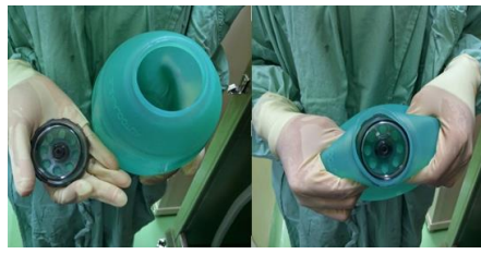
2.4 แล้วยนำไปต่อกับ Ambu หันด้านตามภาพ