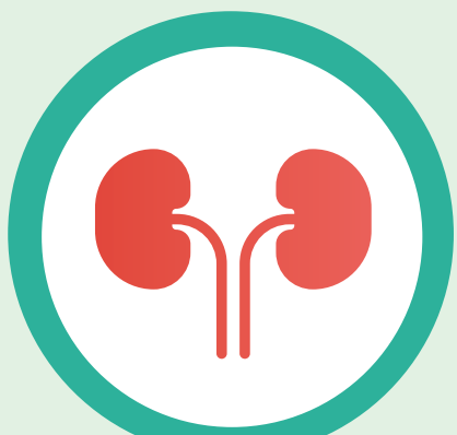
โรคไตเรื้อรัง

กรณีที่ผู้ป่วยโรคมะเร็งเป็นโควิด-19 มีโอกาสที่จะเกิดอาการที่รุนแรงได้ โดยปัจจัยเสริมจากโรคประจำตัวอื่นที่มีอยู่แล้ว เช่น