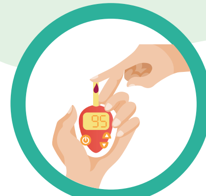
โรคเบาหวาน