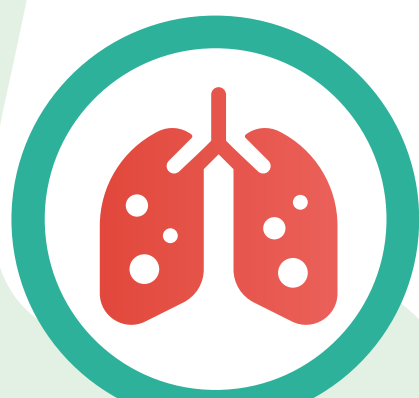
โรคถุงลมปอด โป่งพอง