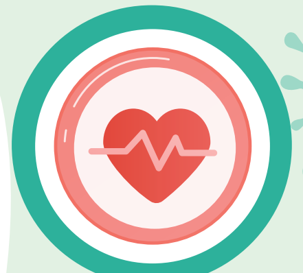
โรคหัวใจ