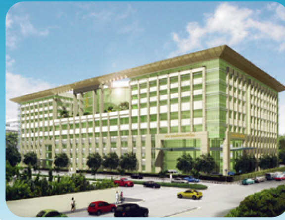
อาคารสมเด็จพระเทพรัตน์

มะเร็งเม็ดเลือดขาว (Leukemia) เป็นมะเร็งที่พบบ่อยที่สุดในเด็ก ซึ่งรักษาโดยเคมีบำบัด หรือการปลูกถ่ายไขกระดูก ยาที่ใช้ในเคมีบำบัดสำหรับการรักษาโรคมะเร็งสามารถก่อให้เกิดผลข้างเคียงต่อร่างกายหลายอย่าง เช่น อ่อนเพลีย คลื่นไส้ อาเจียน ผมร่วง เยื่อช่องปากอักเสบ ติดเชื้อง่าย เนื่องจากปริมาณเม็ดเลือดขาวต่ำ เลือดออกง่าย เนื่องจากปริมาณเกล็ดเลือดต่ำ