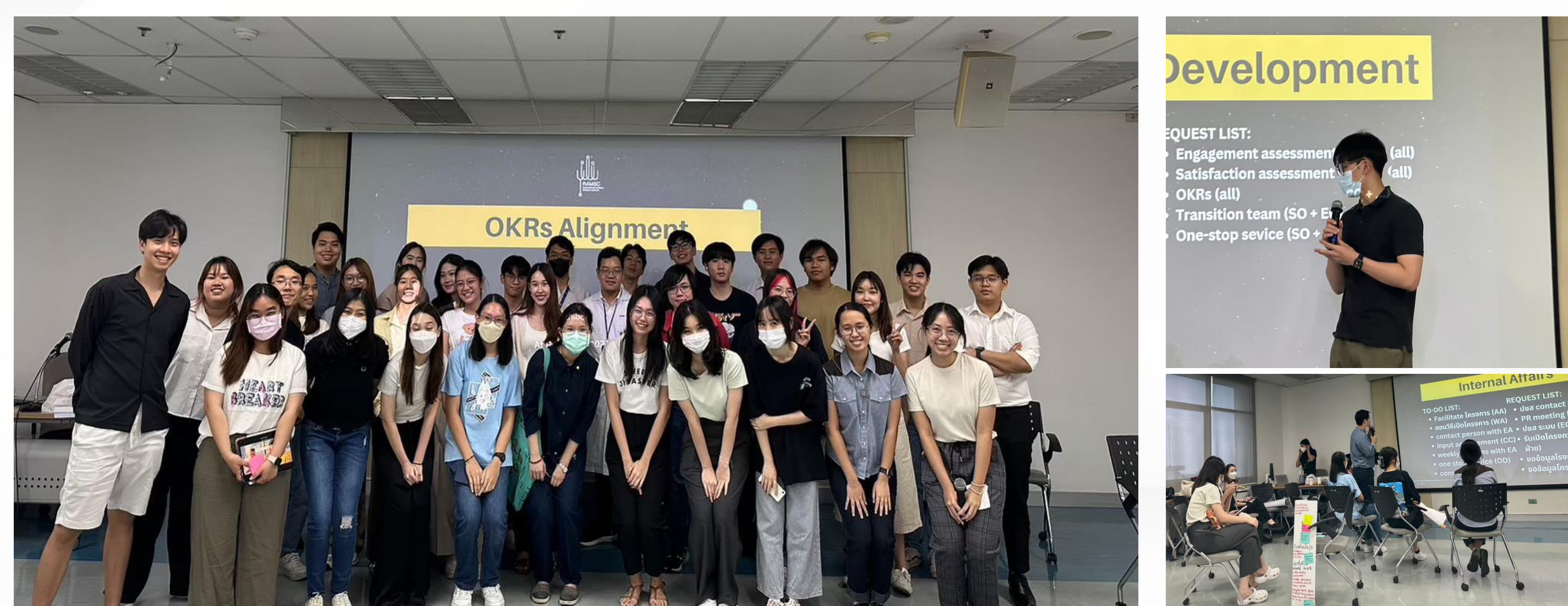
Figure 1, 2, and 3: Knowledge Sharing and OKRs Alignment Workshop

Capacity Building Session for equipping each department's representatives to formulate the passion-sharing goals from their team's visions.