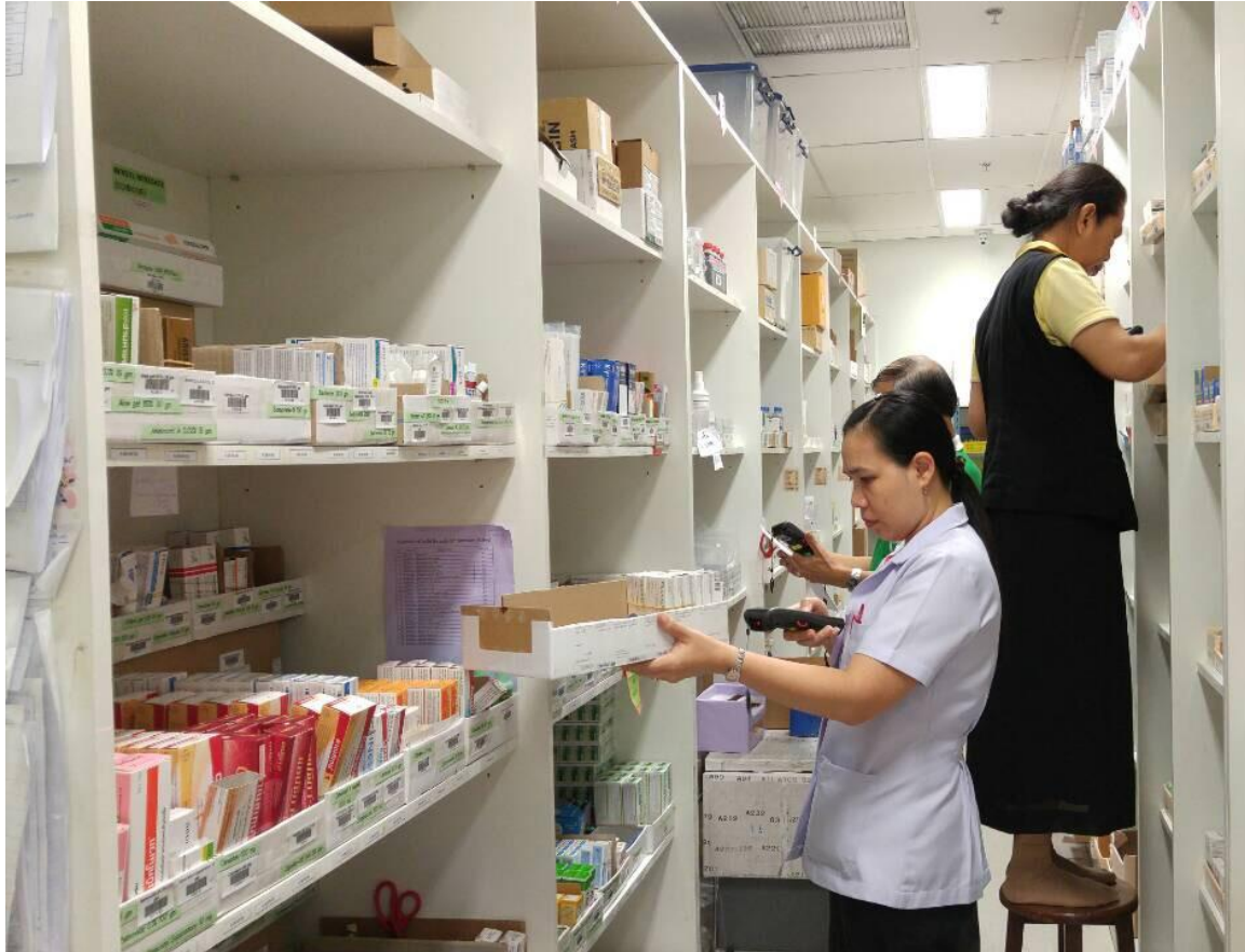
บรรยากาศการนับยาเม็ด