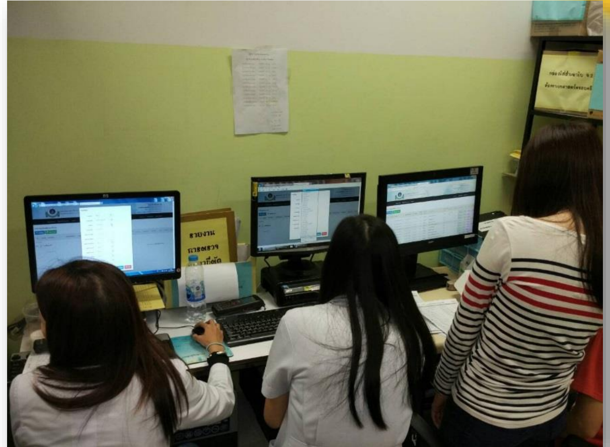
บรรยากาศการตรวจสอบรายงาน