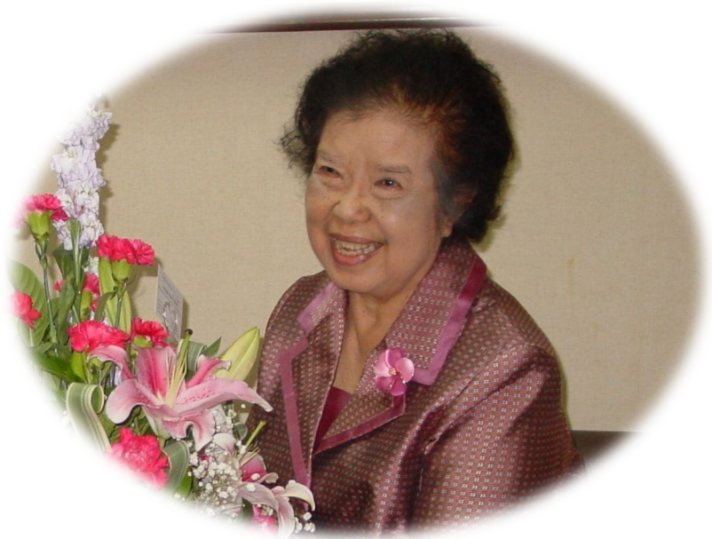
ศาสตราจารย์เกียรติคุณ แพทย์หญิง ม.ร.ว. จันทรีนิวัธ เกษมสันต์