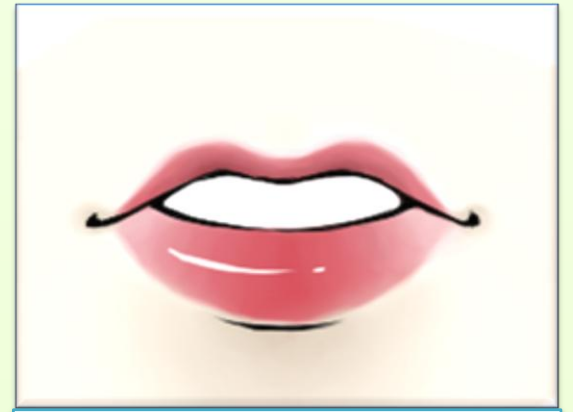
เลือด/สารคัดหลั่งของผู้ป่วยเข้าปาก