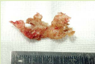
กระดูกตาย