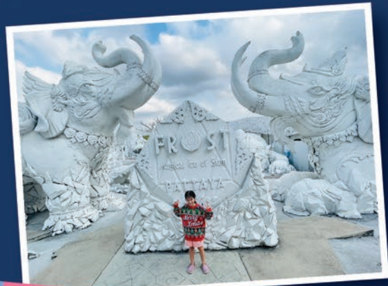
Frost Magical Ice of Siam

สวัสดีค่ะท่านผู้อ่าน @Rama ทุกท่าน ปิดเทอมนี้เฟรนด์จะพาทุกท่านไปเที่ยวพัทยาและบางแสนกันค่ะ อ๊ะ ๆ เอย์ถึงสองที่นี้แล้วอย่าเพิ่งเบื่อกันนะค่ะ ครึ่งนี้เฟรนด์จะพาไปที่ไหน ตามไปสนุกด้วยกันได้เลยค่ะ เริ่มต้นที่ Frost Magical Ice of Siam ตั้งแต่ 9 โมงเช้าค่ะ ที่เที่ยวพัทยานี้เป็นอาณาจักรน้ำแข็งที่ตั้งอยู่ริมถนนกระทิงลาย-พัทยา ในช่วงเช้าแบบนี้อากาศยังไม่ร้อนมาก เฟรนด์เดินเที่ยวชม Zone The Himmapan ประติมากรรมทรายขาวที่บอกเล่าเรื่องราวของป่าหิมพานต์ ด้านหน้าก่อนค่ะ มีหลากหลายรูปแบบมาก ๆ สวย ๆ ทั้งนั้นเลยคะ เฟรนด์ถ่ายภาพมาฝากท่านผู้อ่านบางส่วนนะค่ะ