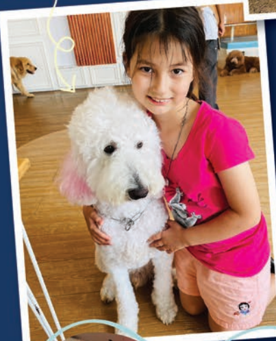
พุดเดิลสแตนดาร์ด

ทางร้านไม่คิดค่าบริการในการมาเล่นกับน้องหมา แต่ให้ฟรี ๆ สั่งอาหาร ขนม หรือเครื่องดื่ม คนละ 1 ออเดอร์คะ ส่วนขนมน้องหมาราคา 69 บาทคะ