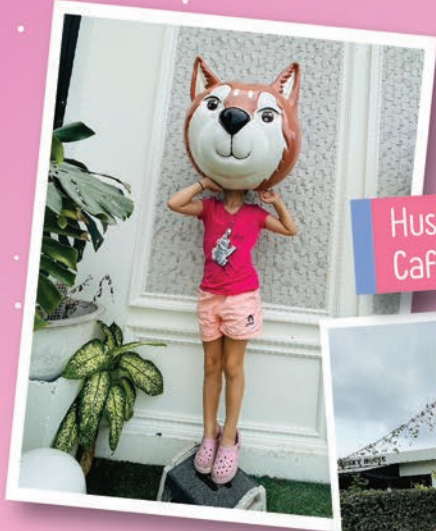
Husky House Cafe'