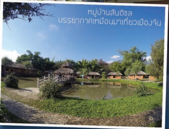
หมู่บ้านสันติชล บรรยากาศเหมือนมาเที่ยวเมืองจ้บ