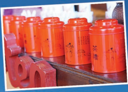
รสชาติของชาที่หอมละมุนไปเหมือนใคร จนอดใจซื้อกลับบ้านไม่ได้

บ้านที่นี้ส่วนใหญ่เป็นบ้านดินเช่นเดียวกับบ้านรักไทยคะ เราจะเห็น บ้านดินอยู่ในหุบเขา มีร้านขายของต่าง ๆ ทั้งของกิน ของใช้ เครื่องราง มีร้าน น้ำชามากมายและสมุนไพรจีน ซึ่งเป็นของขึ้นชื่อของที่นี้คะ หลังอิ่มเอมจากความหอมกรุ่นของใบชาหลากหลาย ชนิด เราก้ซื้อของฝากติดไม้ติดมือกลับบ้าน หลังเก็บอากาศ บริสุทธิ์กันจนเต็มปอดก็ถึงเวลาเดินทางกลับกันแล้วคะ