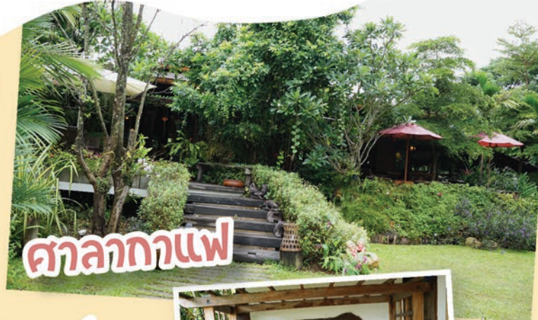
ศาลากาแฟ

เริ่มต้นการเดินทาง ท้องต้งอึมคะ เราแวะร้านอาหารสุดฮิต “ศาลากาแฟ” ที่มีทั้งอาหารคาวและอาหารหวานค่ะ บรรยากาศร่มรื่น เหมาะกับผู้ที่ชื่นชอบบรรยากาศธรรมชาติมากค่ะ