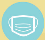
หน้ากากอนามัยเปียก