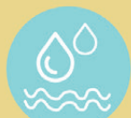
ความสะอาดของน้ำ