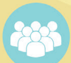
การชุมนุมรวมตัว

อย่างที่สาม น้ำที่ใช้เล่นสงกรานต์นั้นสะอาดเพียงพอหรือไม่ บ่อยครั้งไปที่เราเห็นผู้เล่นสงกรานต์นำน้ำมาจากแหล่งน้ำธรรมชาติและลำคลอง หากน้ำสกปรกกระเด็นเข้าตา เราใช้มือที่สวมถุงมือนี้แหละขยี้ตา .... หรือเราควรจะถอดถุงมือ แต่เราก็ไม่ได้ล้างมือให้สะอาดอยู่ดี ความเสี่ยงที่เชื้อโรคจะเข้าตาก็คงยังมีอยู่