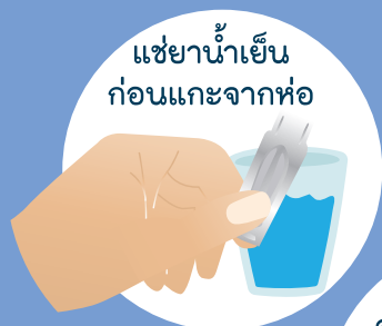
แช่ยาในน้ำเย็น ก่อนแคะจากห่อ