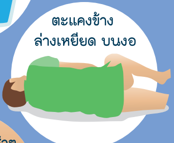
ตะแคงข้าง ล่างเหยียด บนงอ