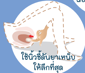
ใช้นิ้วชี้ดันยาเหน็บให้ลึกที่สุด