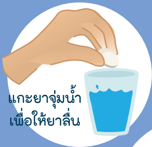
แคะยาจุ่มน้ำ เพื่อให้ยาลื่น

หลายท่านอาจเคยเห็นเครื่องมือช่วยสอดบรรจุในกล่อง ซึ่งจะช่วยให้เหน็บได้ง่ายขึ้น โดยวางยาบนเครื่องมือแล้วใช้นิ้วกลางและนิ้วโป้งจับที่ตัวเครื่อง ส่วนนิ้วชี้ให้แตะอยู่ที่ปลายก้านสูบเพื่อดันยา