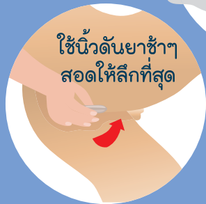
ใช้นิ้วดันยาเข้าไป สอดให้ลึกที่สุด