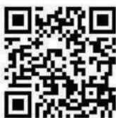
QR code สมัครงาน

http://www2.ra.mahidol.ac.th/rama-career/