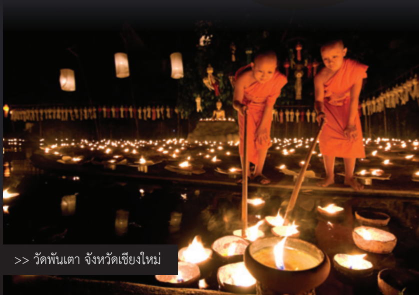
>> วัดพันเตา จังหวัดเชียงใหม่

ในภาคเหนือเรียกประเพณีลอยกระทงว่า “ประเพณีี่เป็ง” หมายถึงวันเพ็ญเดือนยี่ (เดือนยี่คือเดือนสอง ถ้านับตามปฏิทินล้านนาจะตรงกับเดือนสิบสองในปฏิทินจันทรคติไทย) ในเทศกาลยี่เป็งนี้ ธรรมเนียมปฏิบัติของชาวล้านนา นอกเหนือจากการลอยกระทงในแม่น้ำ ชาวล้านนานิยมไปปฏิบัติธรรม ฟังเทศน์มหาชาติตามวัดวาอารามต่างๆ ช่วยกันประดับตกแต่งวัด บ้านเรือน และถนนหนทางสายต่างๆ ด้วยซอประทีป รวมทั้งซอกโคมยี่เป็งรูปแบบต่างๆ ในภาษาพื้นเมืองเรียกว่า “โคมแขวน โคมตั้ง และโคมมัด” โคมเหล่านี้จะถูกซอกขึ้นเพื่อเป็นพุทธบูชา ทำให้ท้องถนนสว่างไสวไปด้วยแสงไฟหลากสีสันตระกานตา พอตกกลางคืนจะมีมหรสพและการละเล่นมากมาย มีการจุดดอกไม้ไฟ แห่โคมไฟพร้อมกับการจุดประทีปหรือผางปะตีบเพื่อบูชาพระรัตนตรัย