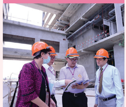
การประชุมและติดตาม ความคืบหน้าโครงการก่อสร้าง สถาบันการแพทย์จักรีนฤเบดินทร์