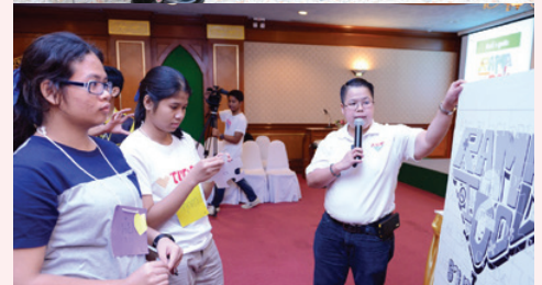
ราม่าไอดอล ปีที่ 2 รอบชิงชนะเลิศ