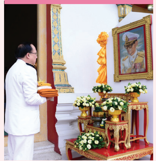
กฐินพระราชทาน ณ วัดบุปผาราม วรวิหาร

@ งานสื่อสารองค์กร คณะแพทยศาสตร์โรงพยาบาลรามาธิบดี มหาวิทยาลัยมหิดล จัดกิจกรรมประชาสัมพันธ์ Application Rama Channel เพื่อให้ประชาชนและผู้ที่มีารับบริการได้รู้จัก Application เมื่อวันที่ 7 ตุลาคม 2558 ณ อาคารสมเด็จพระเทพรัตน์