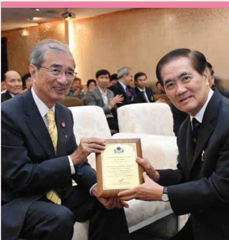
ปาฐกถา อรรถสิทธิ์ เวชชาชีวะ ครั้งที่ 14

@ คณะแพทยศาสตร์โรงพยาบาลรามาธิบดี มหาวิทยาลัยมหิดล จัดงาน “ปาฐกถาอรรถสิทธิ์ เวชชาชีวะ ครั้งที่ 14” เนื่องในโอกาสพิเศษครบรอบสิริอายุ 80 ปี และเพื่อเชิดชูเกียรติ ศ.เกียรติคุณ นพ.อรรถสิทธิ์ เวชชาชีวะ โดยได้รับเกียรติจาก ศ.นพ.รัชตะ รัชตะนาวิน อดีตคณบดีคณะแพทยศาสตร์โรงพยาบาลรามาธิบดี มหาวิทยาลัยมหิดล บรรยายเรื่อง “The Thyroid & Wisdom for Academics” ท่ามกลางความสนใจจากบุคลากรทางการแพทย์ ผู้เข้าร่วมงานในครั้งนี้เป็นจำนวนมาก เมื่อวันที่ 30 ตุลาคม 2558 ณ ห้องประชุมอรรถสิทธิ์ เวชชาชีวะ ชั้น 5 ศูนย์การแพทย์สิริกิติ์