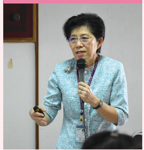
การประชุม ผู้ปกครองของเด็กที่มีความ บกพร่องทางการได้ยิน ครั้งที่ 13