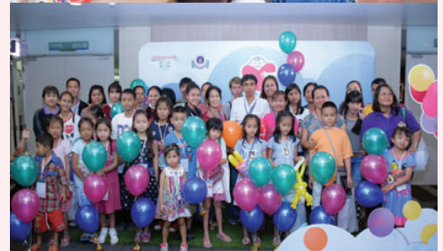
CHD Camp ค่ายกิจกรรมสำหรับเด็กโรคหัวใจ พิการแต่กำเนิด ครั้งที่ 1