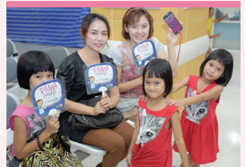
กิจกรรม ประชาสัมพันธ์ Application Rama Channel