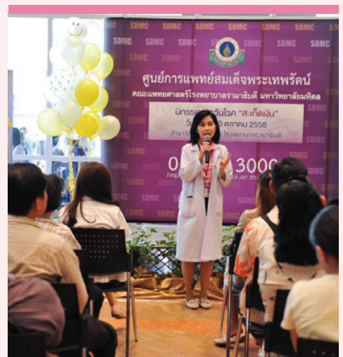
นิทรรศการ โรคสะเก็ดเงิน