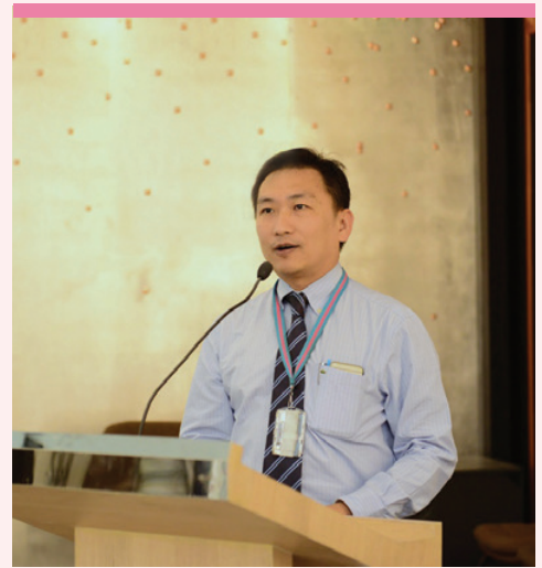
ฝึกซ้อม Tabletop เพื่อรับแผนอุบัติภัยหมู่