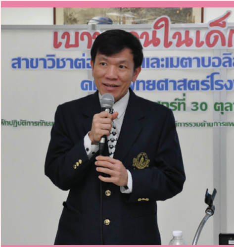
บรรยายให้ความรู้ เรื่อง “อยู่กับเบาหวานอย่างไรให้ห่างไกลภาวะแทรกซ้อน”

@ สาขาวิชาต่อมไร้ท่อและเมตาบอลิซึม ภาควิชากุมารเวชศาสตร์ คณะแพทยศาสตร์โรงพยาบาลรามาธิบดี มหาวิทยาลัยมหิดล จัดโครงการให้ความรู้ผู้ป่วยและครอบครัว เรื่อง “อยู่กับเบาหวานอย่างไรให้ห่างไกลภาวะแทรกซ้อน” โดยได้รับเกียรติจาก ศ.นพ.พัฒน์ มหาโชคเลิศวัฒนา หัวหน้าสาขาวิชาต่อมไร้ท่อและเมตาบอลิซึม ภาควิชากุมารเวชศาสตร์ คณะแพทยศาสตร์โรงพยาบาลรามาธิบดี มหาวิทยาลัยมหิดล กล่าวเปิดงาน โดยกิจกรรมภายในงานประกอบด้วย การบรรยายให้ความรู้เกี่ยวกับอาหารผู้ป่วยเบาหวาน การออกกำลังกาย และการแลกเปลี่ยนประสบการณ์ระหว่างครอบครัวผู้ป่วยเบาหวาน เมื่อวันที่ 30 ตุลาคม 2558 ณ ห้องฝึกปฏิบัติการทักษะทางคลินิก 310-314 ชั้น 3 อาคารเรียนและปฏิบัติการรวมด้านการแพทย์และโรงเรียนพยาบาลรามาธิบดี