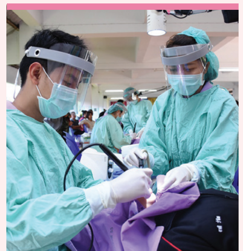
หน่วยแพทย์เคลื่อนที่ พระราชทาน จังหวัดเชียงใหม่