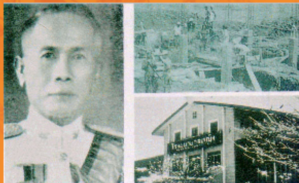
ภาพในอดีตของโรงพยาบาลหญิงและจอมพล ป. พิบูลสงคราม

สถาปนิกท่านก็พิจารณาแจ้งกับผมนะครับว่า อาจารย์ไม่มีทางเลือกอื่นเลยนะ ถ้าไม่มีออร์ดผู้ชายเลย แล้วจะเป็นโรงเรียนแพทย์ได้อย่างไรนะครับ ผมก็เอาลองเอาไปคิดดู ถ้าจะจัดการตามแบบที่สั่งการมานี้จะเป็นอย่างไร สถาปนิกเขาก็บอกมาบอกว่า จะมีค่าใช้จ่ายเพิ่มขึ้น ถ้าจะมีตึกของผู้ชายเข้ามาอีกนะ กับอีกเรื่องคือโรงพยาบาลเด็ก ซึ่งถ้าจะทำทั้งสองโรงพยาบาลนี้ให้เป็นคณะแพทยศาสตร์ฯ จะมีค่าใช้จ่ายสามสิบล้านโดยประมาณหรืออาจจะมากกว่านั้นอีกก็เป็นได้...”