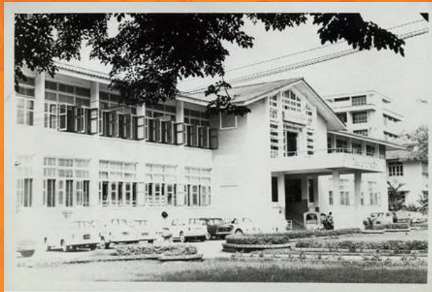
ภาพของโรงพยาบาลเด็ก

ต่อมาในปี พ.ศ. 2519 (22 ปี หลังจากเริ่มเปิดทำการ) คณะรัฐมนตรีได้มีมติให้โรงพยาบาลหญิงเปลี่ยนเป็นโรงพยาบาลที่รักษาโรคทั่วไป ไม่จำกัดเฉพาะเพศและอายุอีกต่อไป ซึ่งพระบาทสมเด็จพระเจ้าอยู่หัว ได้ทรงกรุณาโปรดเกล้าโปรดกระหม่อม พระราชทานนามใหม่ว่า “โรงพยาบาลราชวิถี” และใช้มาจนถึงปัจจุบัน