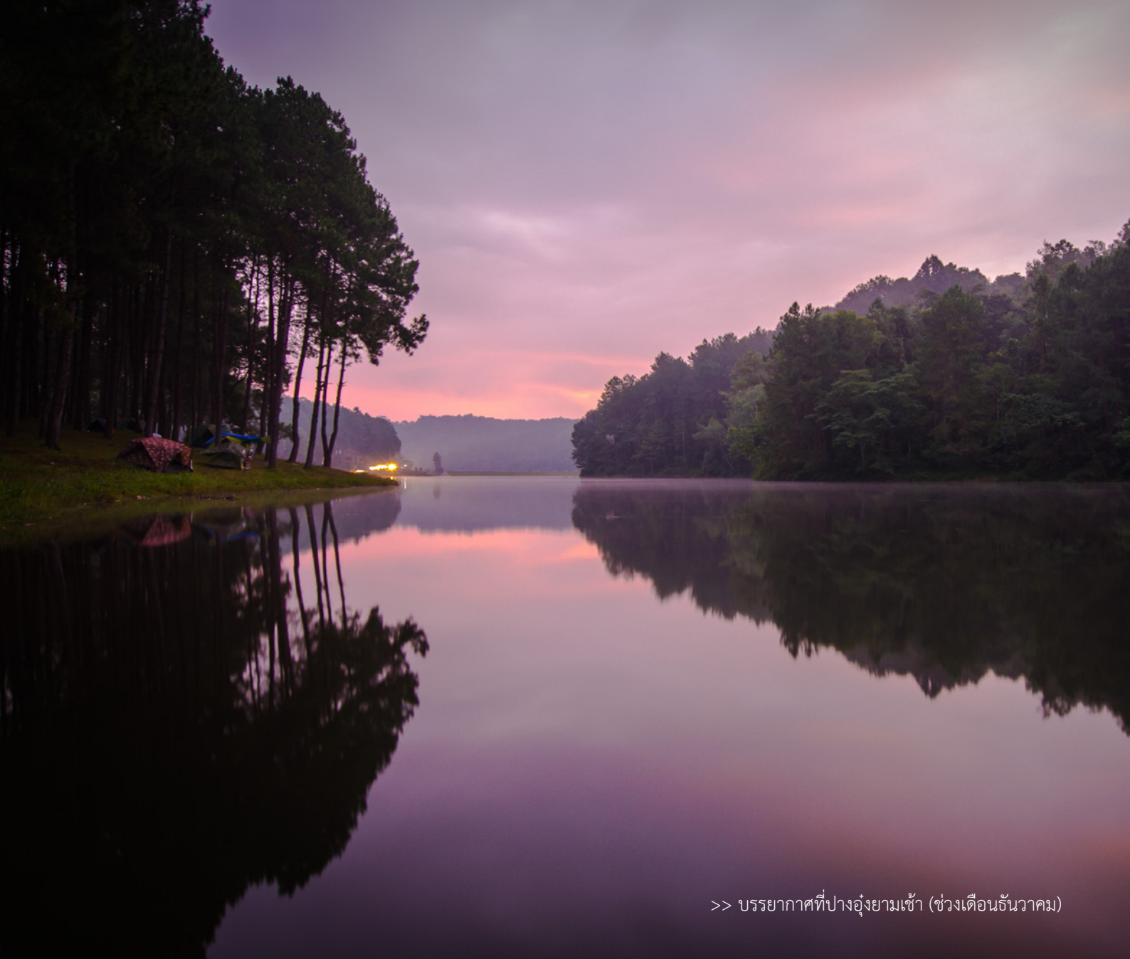
>> บรรยากาศที่ปางอุ้งยามเช้า (ช่วงเดือนธันวาคม)