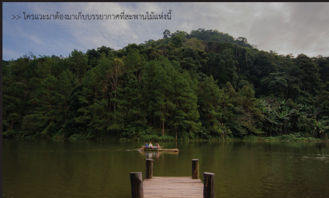
>> ใครแวะมาต้องมาเก็บบรรยากาศที่สะพานไม้แห่งนี้