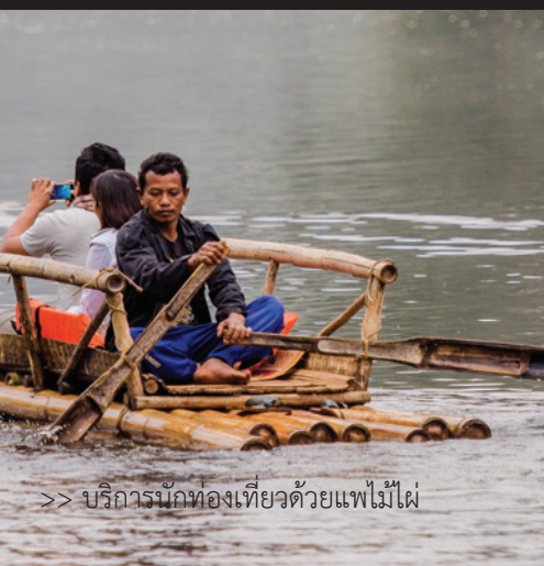
>> บริการนักท่องเที่ยวด้วยแพไม้ไผ่