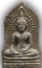
พระศาสดาเนื้อผง ภ.ป.ร.

เชิญร่วมเป็นส่วนหนึ่งของการให้กับมูลนิธิรามาธิบดี ด้วยการบูชาพระศาสดา ภ.ป.ร. ที่มีคุณค่าสูงยิ่งแก่ผู้ที่มีไว้บูชาและเพื่อความ เป็นสิริมงคลสูงสุดของชีวิต รายได้ทั้งหมดจากแรงศรัทธาของชาวไทยจะนำไปสู่การ “ให้” ที่จะมอบชีวิตใหม่ให้แก่ผู้อื่น โดยรายได้ทั้งหมดจะนำไปสมทบกับโครงการพัฒนาอาคารและจัดหาเครื่องมือแพทย์เพื่อผู้ป่วยยากไร้ โรงพยาบาลรามาธิบดี