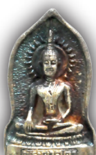
เนื้อเงิน