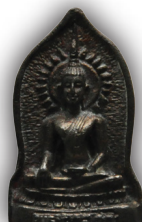
เนื้อนวโลหะ